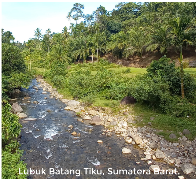
Lubuk Batang Tiku, Sumatera Barat.

Jika dilihat dari bentuk dan pemanfaatannya, Lubuk Larangan bisa dikategorikan termasuk kawasan konservasi IUCN kategori VI. Lubuk Larangan itu berasosiasi dengan nilai budaya ( cultural values ) dan dikelola dengan sistem pengelolaan sumber daya alam tradisional. Walaupun satu Lubuk larangan itu tidak terlalu besar, biasanya sungai kisaran 200-1500m, namun dengan jumlahnya yang banyak, secara kolektif akan membentuk kawasan yang luas. Apalagi jika diperhitungkan daerah sempadan sungai dan Daerah Aliran Sungai (DAS). Kondisi badan perairan dan sempadan Lubuk larangan pada umumnya berada